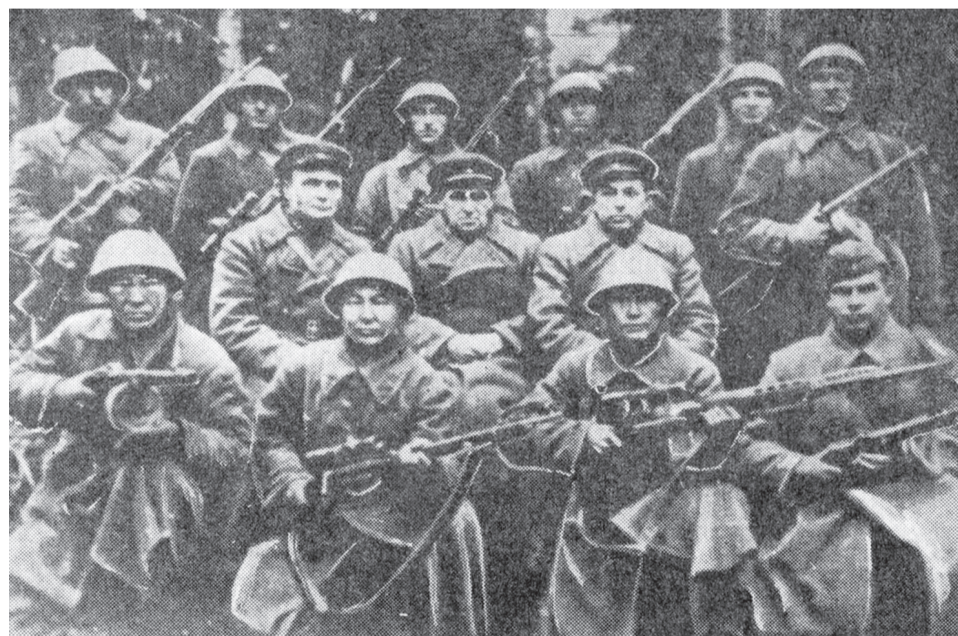
Снимок сделан на дивизионном сборе снайперов (апрель 1943.)

В годы Великой Отечественной войны широкий размах среди воинов Советской Армии получил снайперское движение. Сотни и тысячи наших бойцов обучались меткой стрельбе и стали грозой для захватчиков, уничтожая офицеров, наблюдателей, орудийные и пулеметные расчеты, экипажи танков и даже низко летящие самолеты.