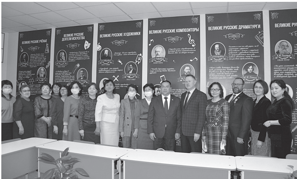
В Атырауском университете им. Х. Досмухамедова состоялась торжественная церемония открытия Центра «Русского языка, литературы и культуры».

Целью открытия Центра является пропаганда русского языка и литературы для студентов университета, знакомство с русской культурой, оказание методической помощи учителям, студентам и магистрантам в научных исследованиях, отметили в пресс-службе региональной АНК.