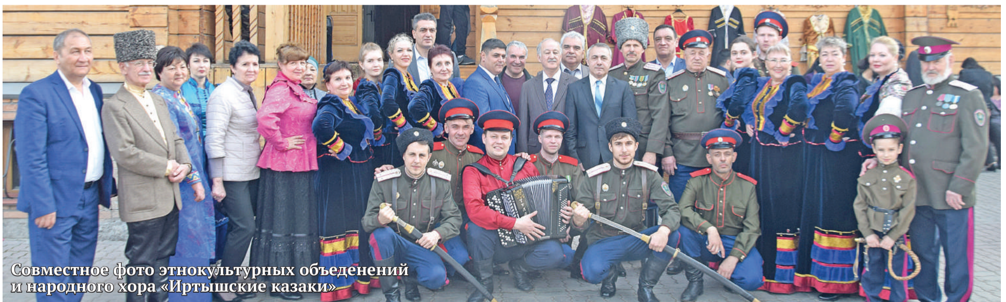
Совместное фото этнокультурных объединений и народного хора «Иртышские казаки»