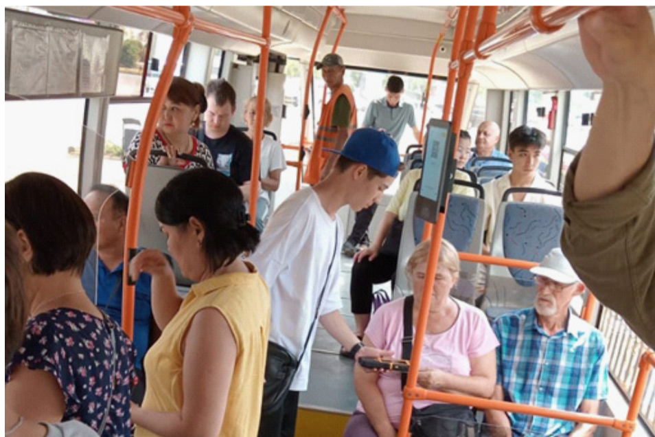
Молодые контролеры на работе