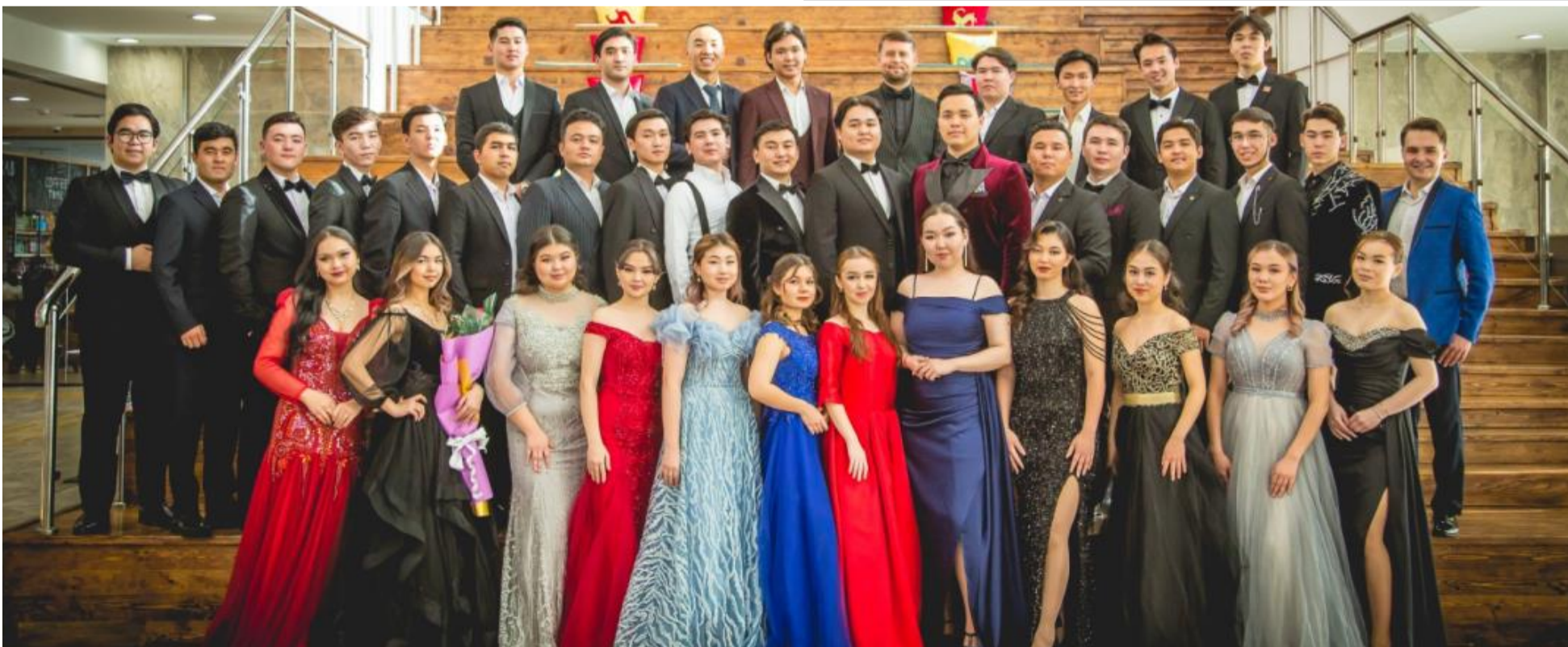
Участники конкурса «Казахская Романсиада-2024»