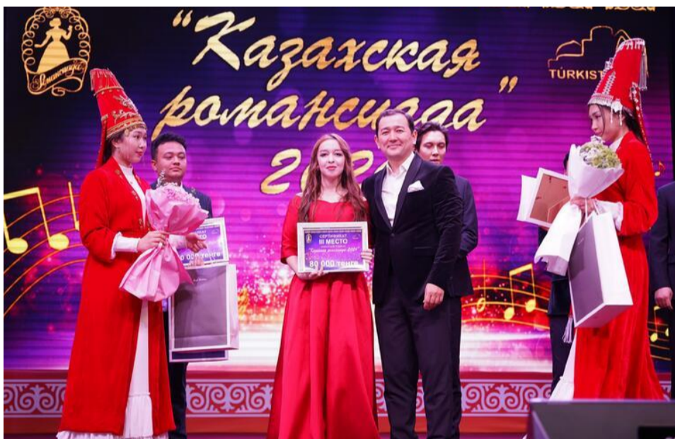
Призы вручает Т.Мусабаев