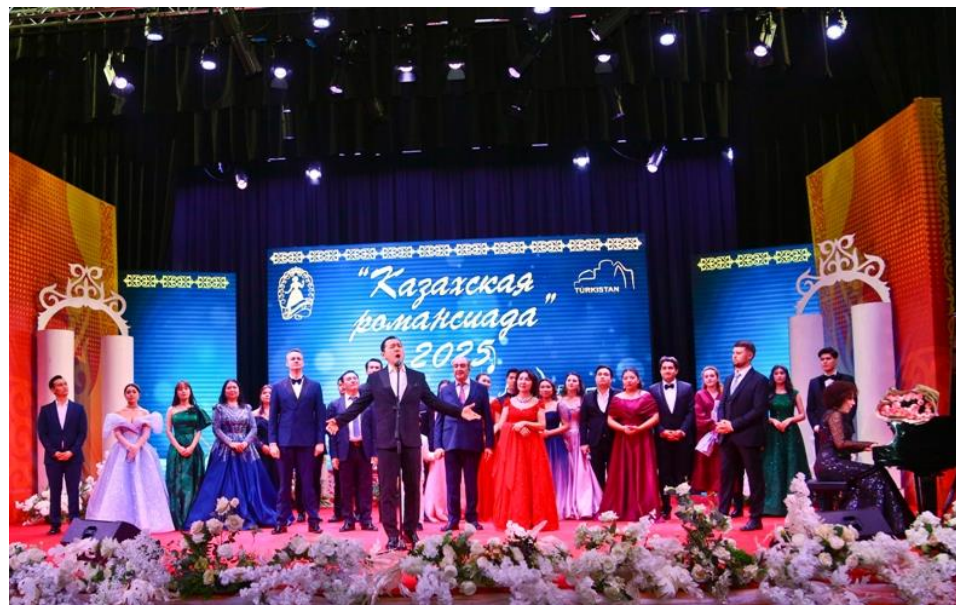
Финальную песню «Айтым сәлем, Қаламқас» исполнили все участники гала-концерта.