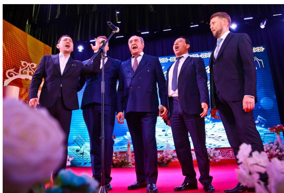
«O sole mio» от пяти баритонов.