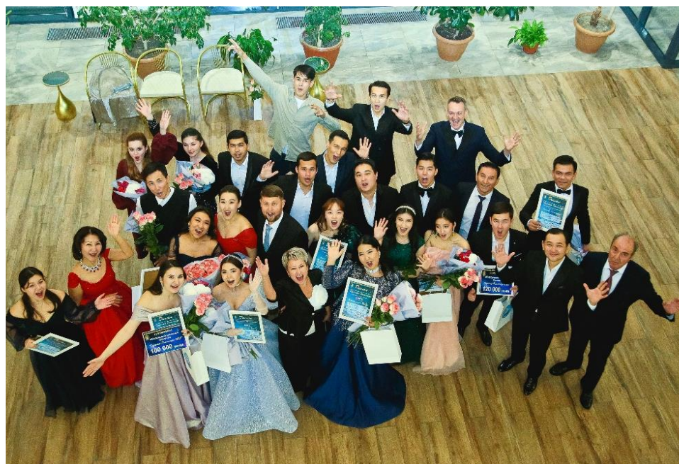
Дипломанты, лауреаты, члены жюри «Казакской Романсиады-2025».