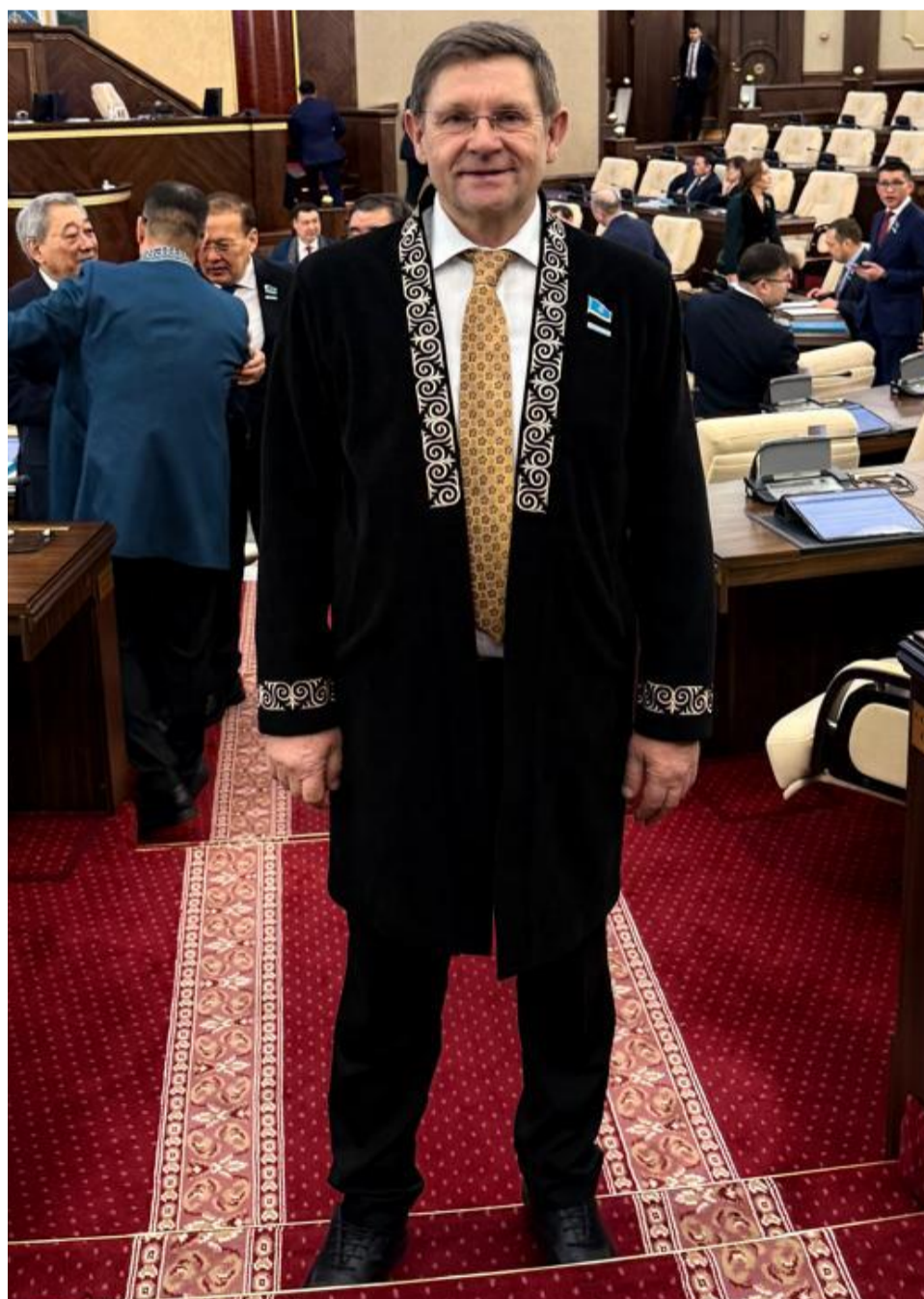
Астана. С. Пономарев