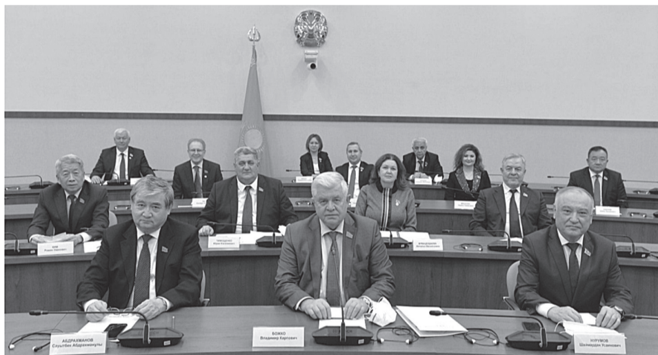
Депутатская группа АНК на онлайн заседании совета АНК