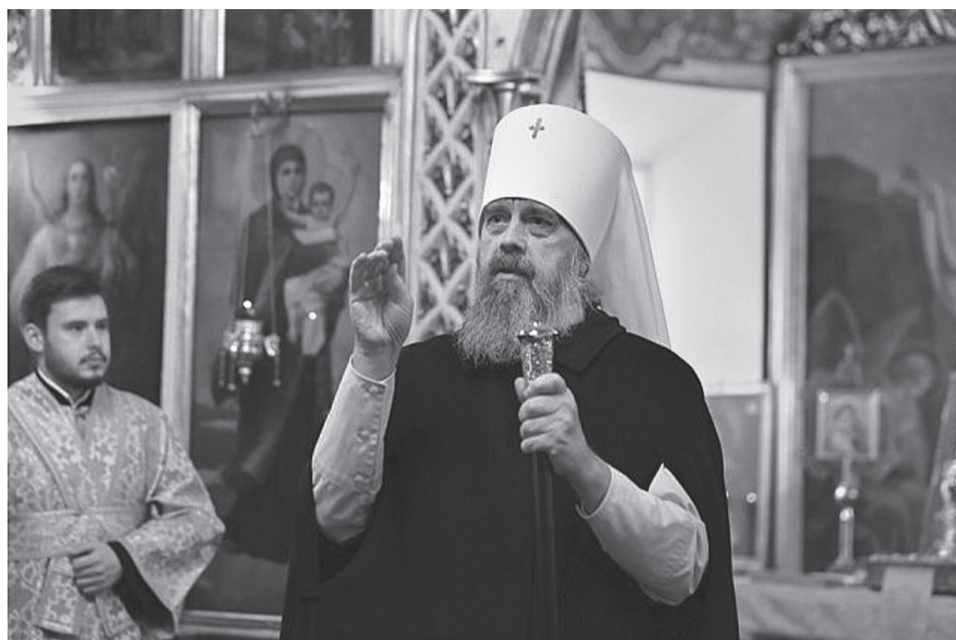
Алексий, митрополит Тульский и Ефремовский.

Помню, стены собора были затянуты белой марлей, пахло краской... Владыка обвенчал нас и благословил.