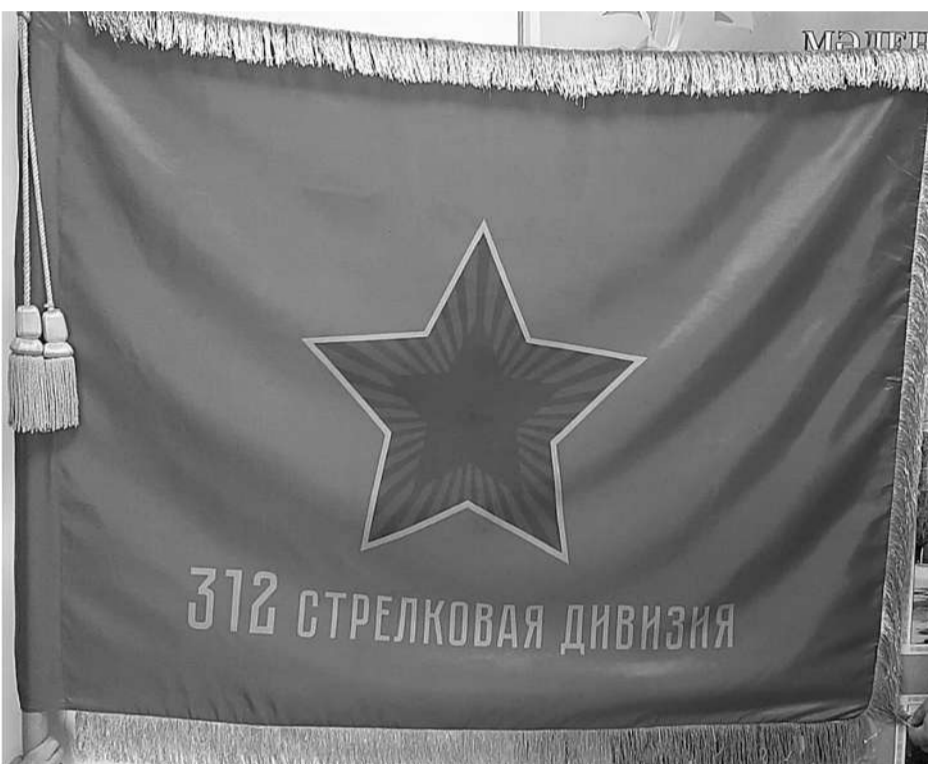
Копия знамени 312-й стрелковой дивизии. Фонд Военно-исторического музея НВПЦ ВС РК.

Орехово-Иварково-Корсаково. 23 октября остатки дивизии обороняли деревню Орехово.