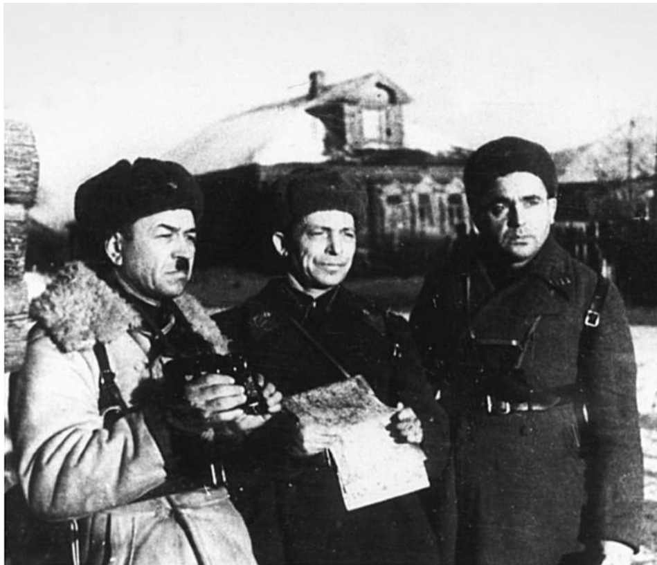
Командир 316-й стрелковой дивизии генерал-майор И. В. Панфилов (слева) с офицерами штаба на передовой, 1941 г.

В таких условиях началась в сентябре 1941 года битва за Москву, которая про-