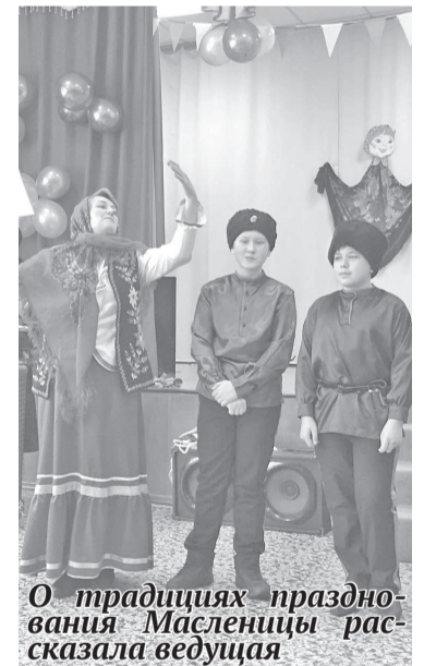
О традициях празднования Масленицы рассказала ведущая

Все участники были единым большим общим праздником: вместе смеялись и делились своим чудесным настроением!