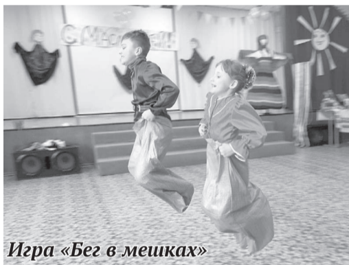
Игра «Бег в мешках»

С Масленицы начинались весна, пробуждение природы, солнце наполняло энергией все живое и давало пищу, свет и тепло людям. Старинная традиция празднования