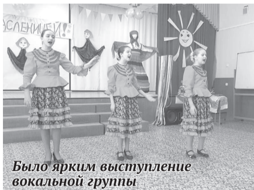
Было ярким выступление вокальной группы