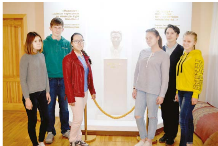
Участники «Театрального разезда» у бюста Н. Ф. Погодина в фойе театра.

Очередной театральный сезон в лицее закрыт, но пятерых лицеистов – артистов «Театрального разезда» – ждут в Иркутске на «Каникулы с хлопковцами». Именно так называется совместный летний творческий отдых на Байкале артистов Иркутского академического драматического театра им. Н. П. Охлопкова и школьников из